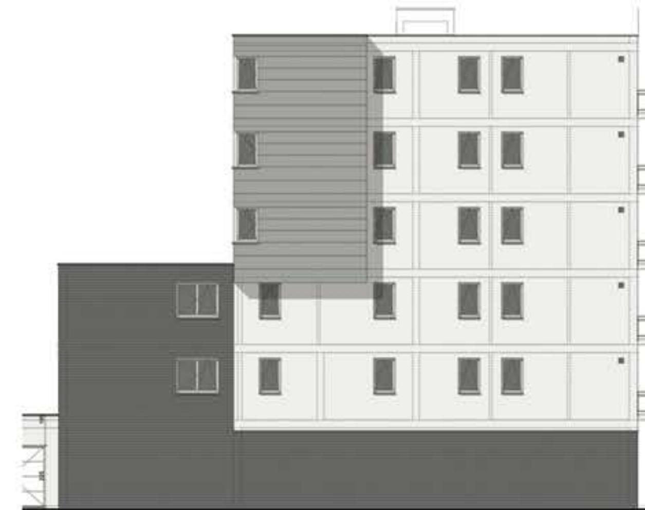
VOORGEVEL PRESIDENT J.F. KENNEDYLAAN