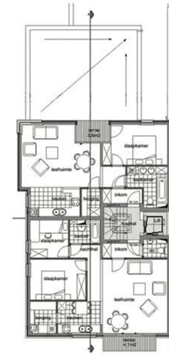
DERDE (VIERDE, VIJFDE) VERDIEPING