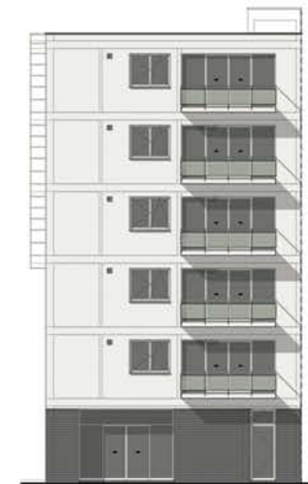
VOORGEVEL GROTE MARKT