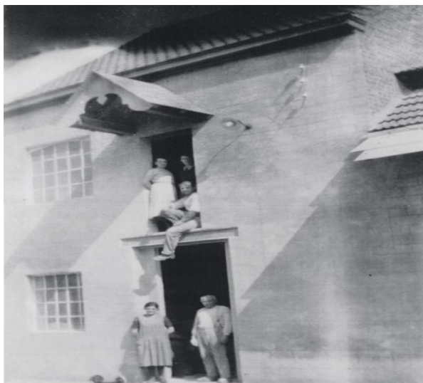
De eerste gebouwen van het bedrijf lagen in de Sint-Antoniussstraat.

Het Inex Experience Centre is eigenlijk het gebouw van molenaar Pycke, de vader van Herman Pycke. Het oude bedrijf was gelegen in de Sint-Antoniussstraat maar in 1974 kwam er een uitbreiding naar de site waarop Inex nu staat. (Lees verder onder de foto)